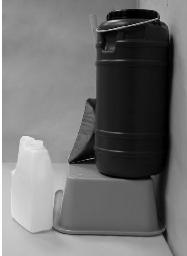
Τρίτη φωτογραφία: Πλάγια όψη