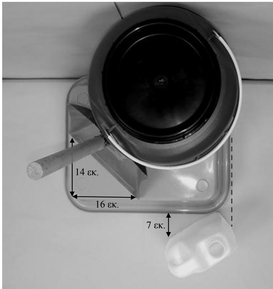
Δεύτερη φωτογραφία: Κάτοψη