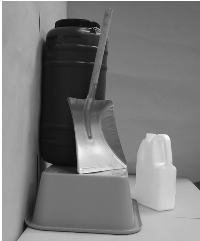
Τέταρτη φωτογραφία: Πλάγια όψη