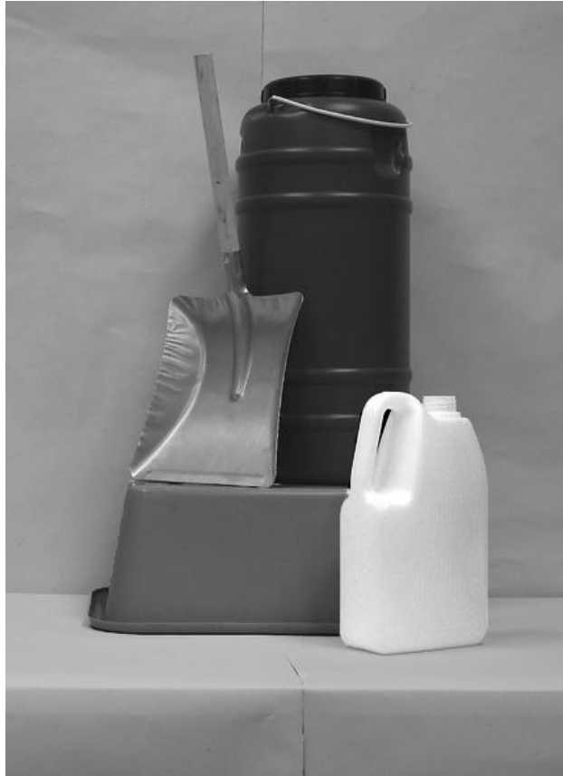
Πρώτη φωτογραφία: Μπροστινή όψη