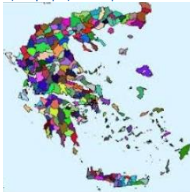
Πίνακας 2: Αριθμός διαθέσιμων θέσεων ανά δήμο