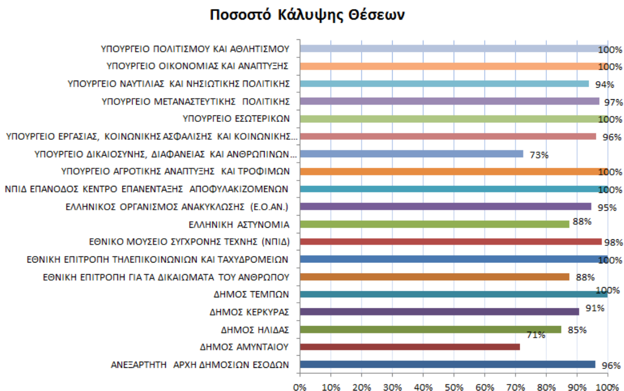
Εικόνα 3: Ποσοστό Κάλυψης Θέσεων