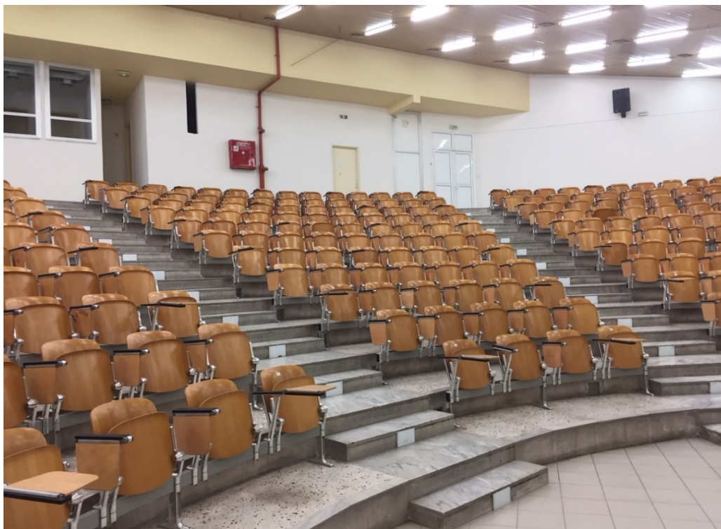
Άποψη του κεντρικού αμφιθεάτρου